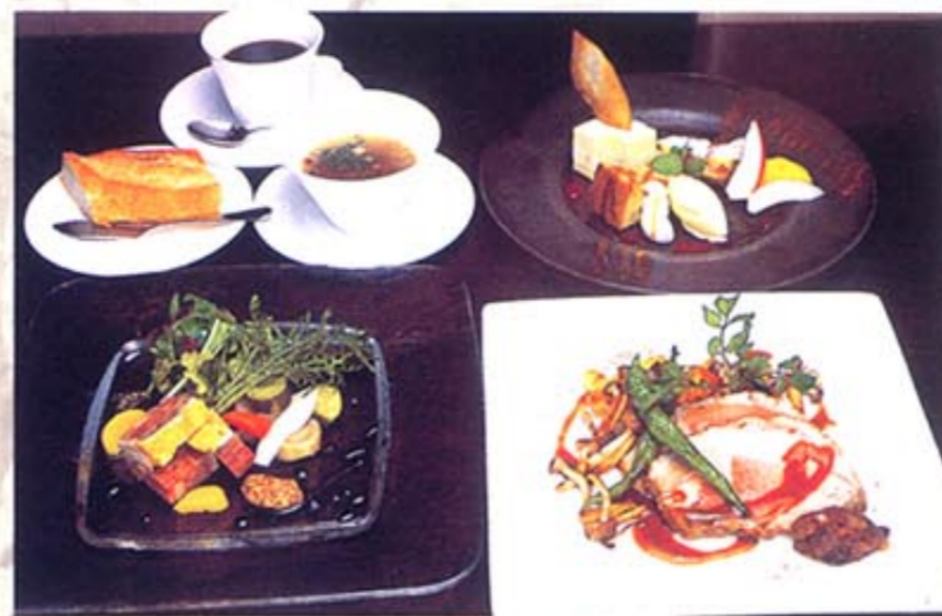
↑旬や食材にこだわり、2週間ごとに内容が変わる(コース2500円~)

セカンドハウスと言えば、京都でよく知られるパスタ&スイーツのカフェ。ここは本格フレンチが手頃な値段で味わえ、卒業生のウェディングにもよく利用される。