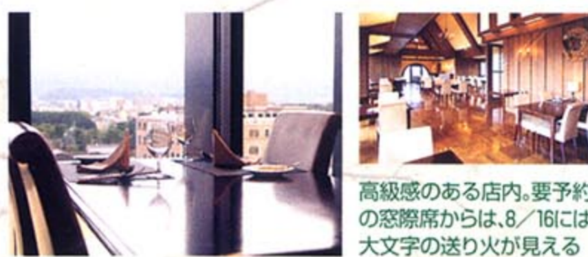
高級感のある店内。要予約の窓際席からは、8/16には大文字の送り火が見える